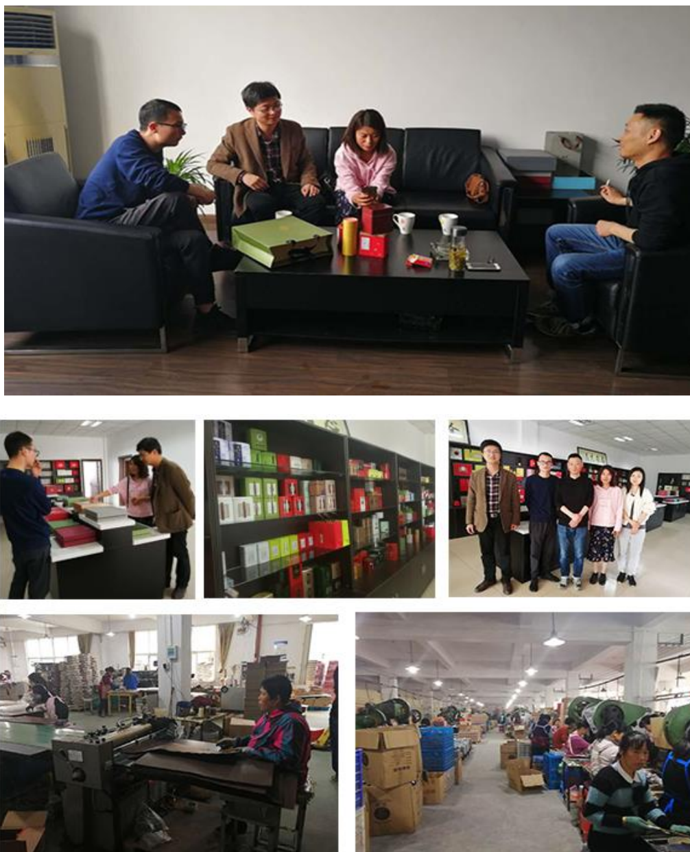
图 1 与汇丰包装开展合作交流

《视觉传达设计专业教学资源库项目》、安徽省教学研究项目《工作室“包装设计”线上教学与实践过程可视化研究》、安徽省教学示范课项目《包装设计》、校级课程思政示范课程项目《包装设计》、校级教研项目《服务设计理念的校企合作课程体系构建研究-以包装设计课程为例》等。