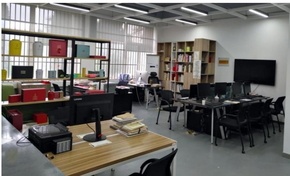
图5 包装设计工作室