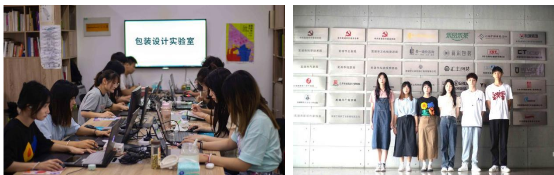
图 2 学生创新创业

在开展创业实践中，校企双方共同促进创新创业教育与专业教育有机融合，企业导师积极指导创新创业，组织学生参加安徽省大学生创新创业项目，2021 年-2023 年，依托包装设计工作室，获得安徽省互联网+大学生创新创业大赛银奖两项、铜奖 1 项。